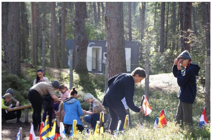
Viens no Bulduros, Buļļuciema un Lielupes iedzīvotāju forumiem

Forumi ir formāts, ko mēs esam izvēlējušies aktīvākai iedzīvotāju iesaistei. Tajos vienmēr ir moderatora vadīta diskusija, iespēja uzdot jautājumus, radošās darbnīcas, muzicē mazie jūrmalnieki. Reizē tas ir arī mūsu atbalsts apkaimes muzejam – Jūrmalas Brīvdabas muzejam, kas ir vietējā kultūrvieta un apkaimes iedzīvotāju tikšanās vieta. Ļoti ceram, ka kādā pārskatāmā nākotnē muzejam taps arī ziemas ēka, jo šobrīd aktivitātes muzejā varam īstenot tikai gada siltajos mēnešos. Būtisks bijis arī dialogs ar pašvaldību – maija forumā pie mums viesos bija Jūrmalas Attīstības pārvaldes Stratēģiskās plānošanas nodaļas vadītāja, iedzīvotājiem bija iespēja uzzināt gan par pilsētas Attīstības programmu, gan arī tieši uzdot jautājumus, sniegt priekšlikumus. Konstruktīva saruna draudzīgā, neformālā atmosfērā. Esam arī novērojuši, ka tie, kas ir jau piedalījušies, piedalās arī nākamajos forumos.