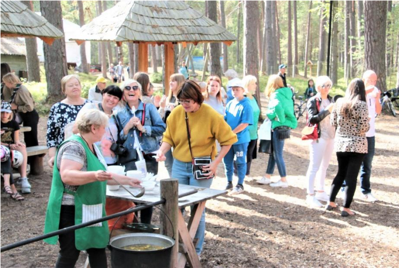
Ragakāpas vides festivāls

Priecājamies, ka 24. novembrī viesosieties NVO namā un kuplināsiet konferences “Apkaimju nozīme un attīstības perspektīva” programmu. Vai un kā Jūrmalā attīstās apkaimju kustība? Vai apkaimju jēdziens ir aktuāls?