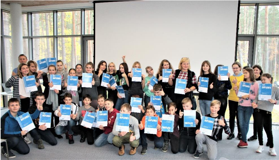
Zilā karoga vēstnešu programma Jūrmalas jauniešiem

ir bijis no Sabiedrības integrācijas fonda, Aktīvo iedzīvotāju fonda, kas ļāvuši mums īstenot projektus un arī stiprināt mūsu pašu kompetenci, rīkot iedzīvotāju forumus.