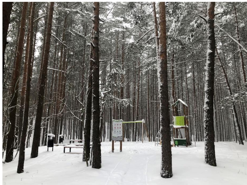
Bulluciema bērnu laukums, ko biedrība labiekārto