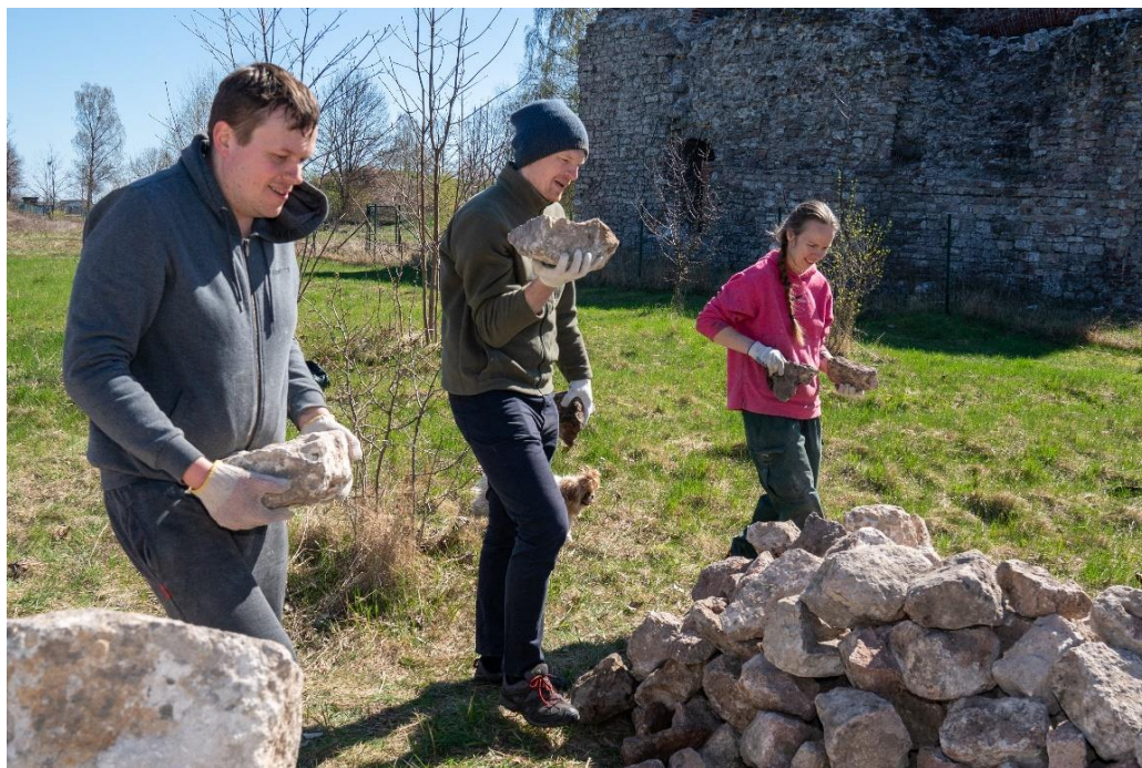
Apkaimju koordinators dalība Lielajā talkā ar apkaimes iedzīvotājiem Daugavgrīvas cietoksnī 2023. gada aprīlī

Arī Kleistu, Voleru un Spilves apkaimju iedzīvotāji aicināti dibināt biedrības, lai savu viedokli konstruktīvāk pārstāvētu pašvaldībā risināmos jautājumos.