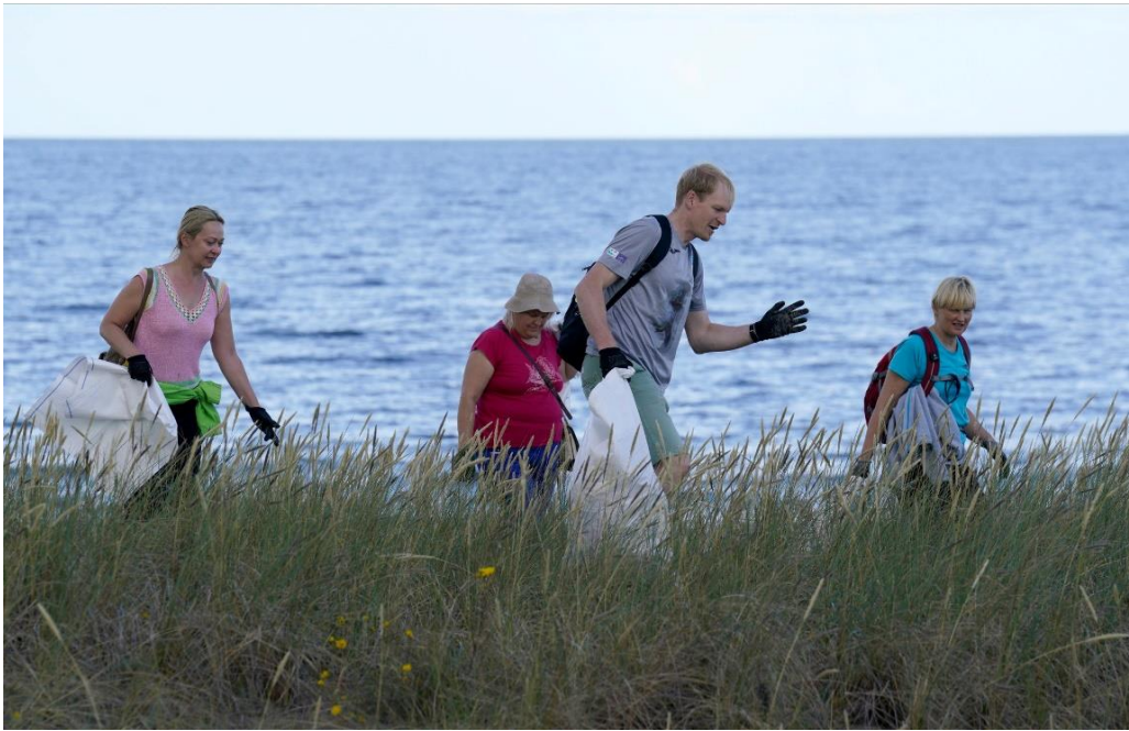
Apkaimju koordinators un koordinators palīdzes dalība invazīvās sugas – Tatārijas salāta - ravēšanas talkā dabas parkā "Piejūra" Daugavgrīvā kopā ar pašvaldības pārstāvjiem un iedzīvotājiem 2023.gada jūlijā