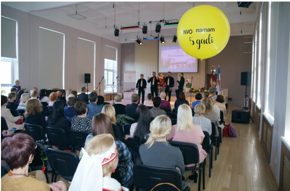
NVO nama 5 gadu jubilejas pasākums 2018. gada septembrī

Prieks par organizācijām, ar kurām izveidojusies sadarbība vairāku, pat visu desmit gadu garumā. Īpašs prieks par ikvienu jaunu NVO, kas atrod ceļu uz NVO namu, nāk un rod te vietu un iespējas īstenot savas idejas un mērķus.