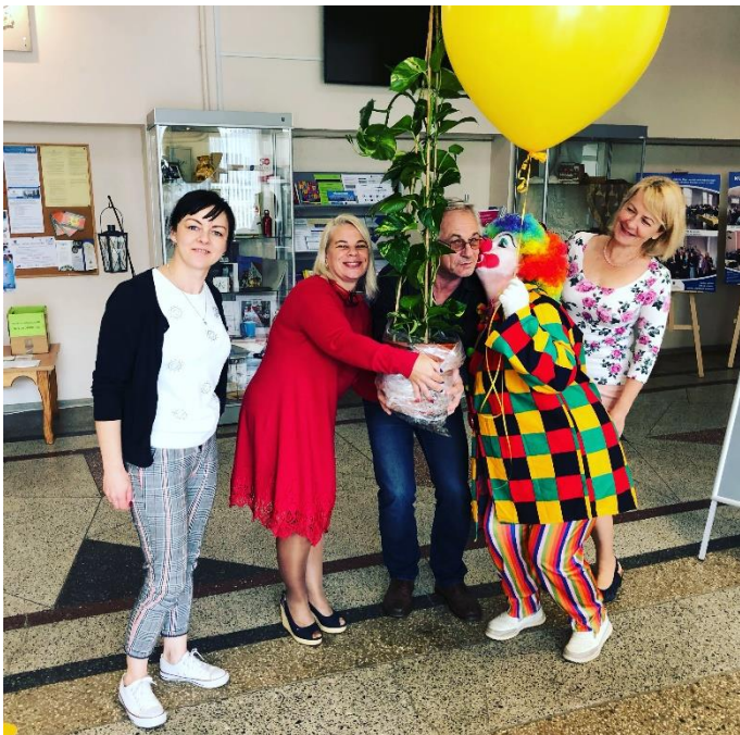
Atzīmējot NVO nama 8 gadu jubileju, 2020. gada septembrī