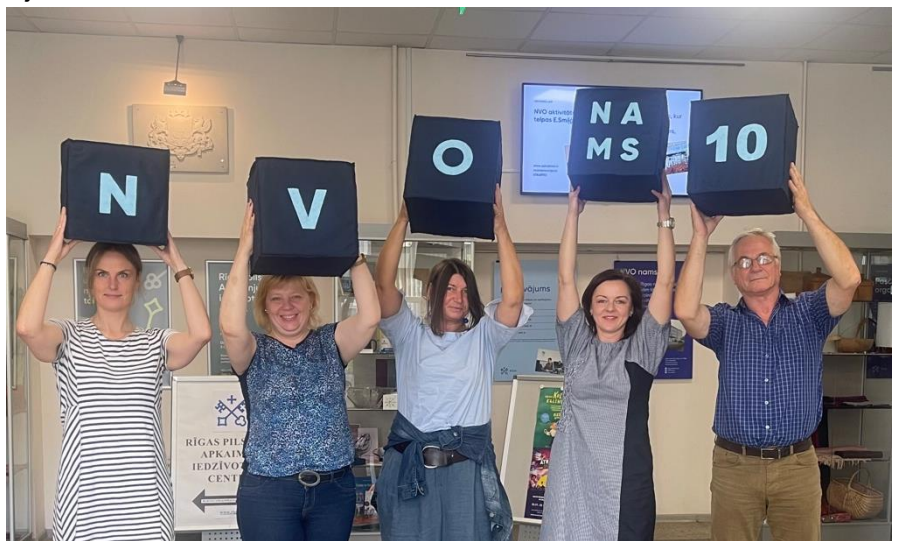
NVO nama kolektīvs kopā ar NVO pārstāvjiem gatavojas 10 gadu jubilejas pasākumam