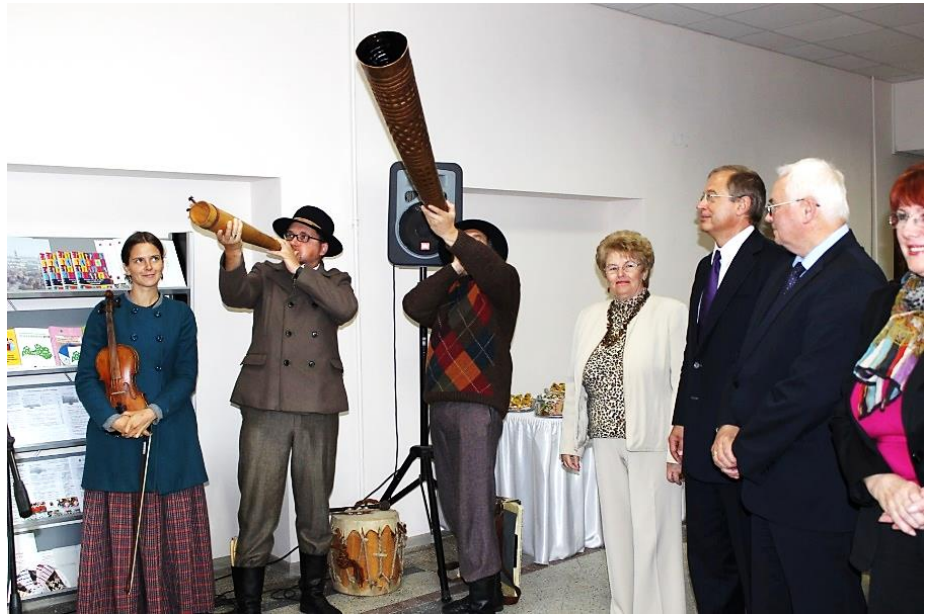
NVO nama atklāšana 2013. gada 25. septembrī

Šāds pašvaldības atbalsts nevalstiskajam sektoram NVO nama veidolā Latvijā ir vienīgais. Ne velti pieredzes apmaiņas vizītēs NVO namu apmeklē citu Latvijas pašvaldību pārstāvji. Jāuzsver arī, ka šāds pašvaldības un nevalstisko organizāciju sadarbības modelis tika novērtēts starptautiski - Eiropas līmenī, kad pāris gadus atpakaļ NVO namu atzina par labās prakses piemēru, un tas kalpoja par paraugu tādām Eiropas pilsētām kā Sirakūzas Itālijā, Espo Somijā, Santa Pola Spānijā, Dubrovnikā Horvātijā un Braitona un Hava Lielbritānijā. Daloties ar pieredzi, gūvām arī paši – izveidojām NVO nama uzlabošanas plānu, noformējās vietējā atbalsta grupa, ieviesām jaunus digitālos risinājumus un izveidojām jaunas sadarbības formas ar NVO.