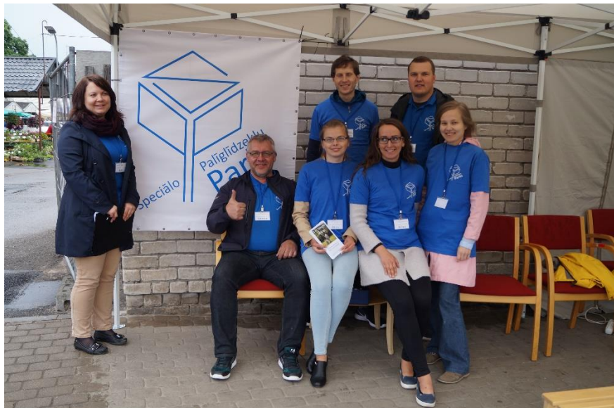
Pasākumā "Lai drošs solis!", kopā ar brīvprātīgajiem - RSU studentiem

Priecājamies, ka NVO nama rīkotajos semināros redzam arī pārstāvjus no jūsu biedrības. Vai šāds pašvaldības atbalsts ir vērtīgs Jūsu organizācijai?