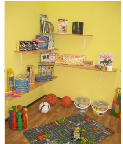
Ar "ADRA Latvija" atbalstu iekārtotā rotaļu telpa Ilūkstes vidusskolā, 2012. gads

prieks – bērns saņem iespēju aizbraukt uz nometni un, iespējams, piedzīvo vasaras spilgtāko nedēļu, arī daudz ko iemācās, savukārt uzņēmējam ir gandarījums, ka viņš ar savu darbu var radīt šādu pievienoto vērtību.