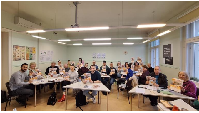
Ukrainas civiliedzīvotāji apgūst latviešu valodu projektā "Visaptveroša mācību programma bēgļiem no Ukrainas"

pilsonisku, iekļaujošu sabiedrību Latvijā un citur Eiropā. Īstenojam Eiropas Savienības mērķus un vērtības, lai cilvēki dzīvotu mierā, draudzētos, sadarbotos un vairotu savu labklājību. Biedrības 12 pastāvēšanas gados īstenoti vairāk nekā 40 projekti, no tiem lielākā daļa ar ārvalstu partneriem. Īstenojam projektus izglītības, kultūras, integrācijas, pilsoniskās sabiedrības un reģionu attīstības, kā arī Eiropas Savienības prioritāšu jomās.