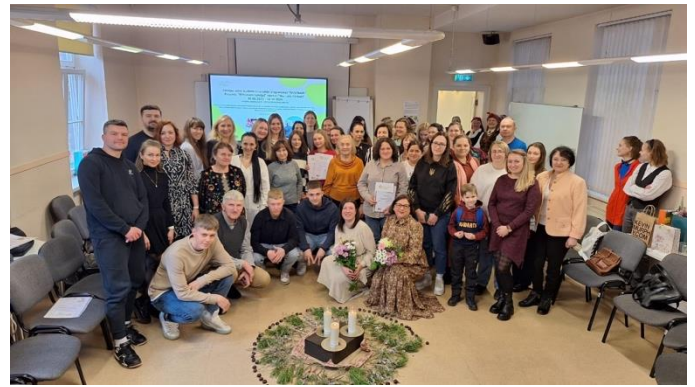
Pasākums "Latvijas dzīvesziņa un tās izziņāšana" projektā "Mēs esam Latvija!"; 2024. gada februāris

2024. gadā Igaunija, Latvija un Lietuva tika iekļautas Ukrainas Reģionālajā bēgļu rīcības plānā. Bēgļu rīcības plānu koordinē ANO un tas ir daudzu partneru un vairāku nozaru plāns, kas kalpo kā papildinājums attiecīgajām valdību vadītajām atbildes darbībām, lai nodrošinātu aizsardzību un atbalstu bēgļiem no Ukrainas. 2023. gadā šajā plānā ir iekļauta arī Latvijas nevalstiskā organizācija "Radošās Idejas". Biedrība "Radošās Idejas" regulāri sazinās un ziņo ANO Bēgļu aģentūrai, UNHCR pārstāvniecībai Ziemeļvalstīs un Baltijas valstīs par plāna īstenošanu - integrācijas projektu realizāciju.