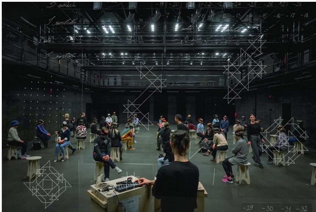
Izrāde "Labra nams". Foto no biedrības "Tuvumi" arhīva

Izrādē "Labra nams", neatkarīgi no tā, kāda ir apmeklētāju redzes kvalitāte, vienalga, vai cilvēks ir pilnībā redzīgs, vai varbūt ir vājredzīgs, varbūt nemaz neredz, mēs pilnīgi visiem apmeklētājiem aizsienam acis. Izrādes norises telpa un apmeklētāju atrašanās vieta ir viena un tā pati telpa, un šajā telpā starp apmeklētājiem pārvietojas dejojāji un atskaņo ierakstus. Līdz ar to, pieredze no vizuālās uztveres pārceļas uz telpā esošu un kinētisku skaņu, uz sajūtu, ka cita cilvēka ķermenis ātri pārvietojas garām un rada vēju. Pārceļas uz smaržu, uz to, ka caur sēdvietu var sajūst vibrācijas, ko rada dejojāju veidotie soļi. Protams, ka vizuālais aspekts joprojām ir, taču tai mirklī - ļoti individuāls un personīgs, katram apmeklētājam vizuāli iegrimstot sevī, savās pārdomās, savā iekšējā labirintā vai ceļojumā. Noteikti jāpiebilst, ka "Labra nams" pieredze nav par to, kā ir neredzēt, jo to nav iespējams reproducēt, uz īsu mirkli aizverot acis.