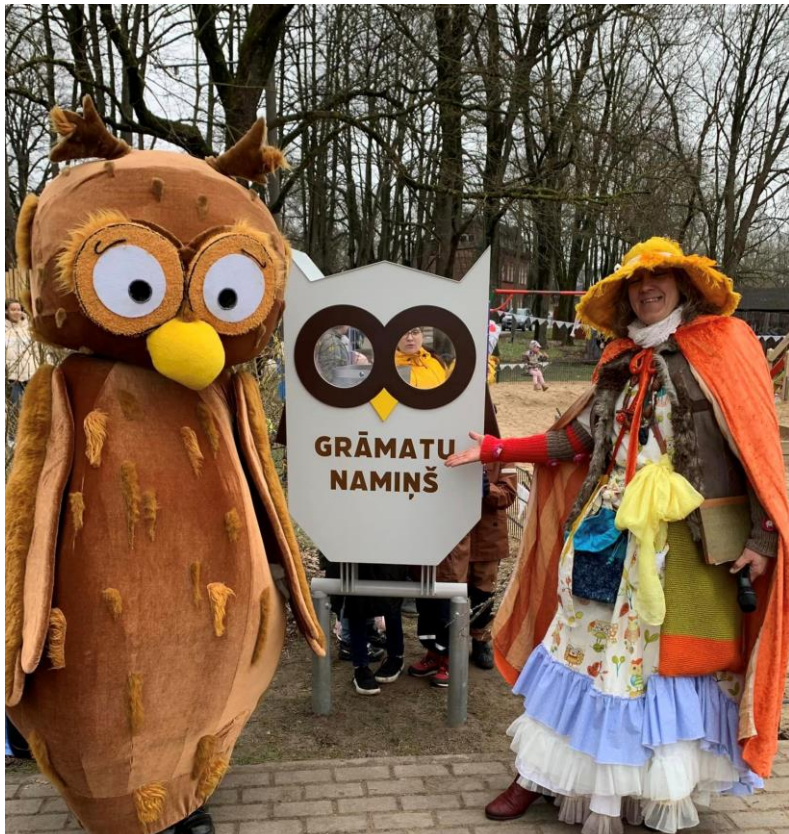
Bērnu un jauniešu grāmatu namiņa atklāšana

laukums, trenāžieri, laipa pie dīķa. Šai pašā finansējumā ar parku uzvarējām arī otro reizi, un drīzumā gaidām apgaismojumu, kas ir iespēja ne tikai ilgāk palikt parkā, kad jau gana agri satumst, bet arī apkaimes drošības jautājums.