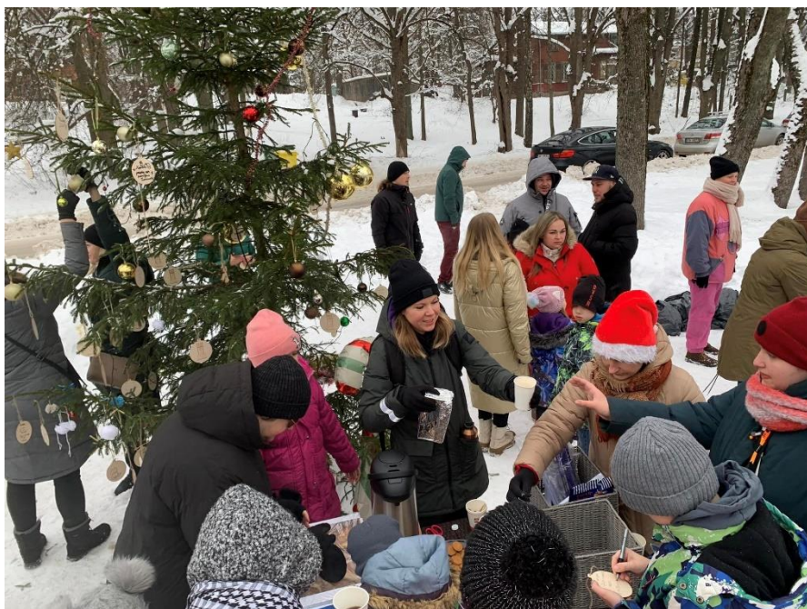
Ziemassvētku egles rotāšanas pasākums

Mēs nekad neesam gājuši vākt biedrus skaitam. Mums svarīgākais ir aktīva vēlme iesaistīties, reaģēt, atbalstīt, dalīties. Par vislabāko saziņas formu esam atzinuši kopīgu čatu un klātienes tikšanās, un kā ikgadējs atgādinājums biedriem, ka joprojām ir griba darboties, tā ir biedra nauda. Tieši klātienes tikšanās notur motivāciju darboties un veidot jaunas idejas. Tāpat ļoti svarīgas ir tradīcijas, kā egles rotāšana, jo pat tad, ja pašam gribas paņemt pauzīti, ir iemesls izdarīt vismaz to mazumiņu, ko cilvēki gaida. Tomēr darboties ar apkaimes vārdu ir arī liels izaicinājums, jo ir dažādi iedzīvotāji un idejas mēdz atšķirties. Ir jāsaprot arī pašas biedrības prioritātes, virzieni, lai saprastu, kāpēc izvēlamies aizstāvēt tieši šo darbības soli, ne citu.