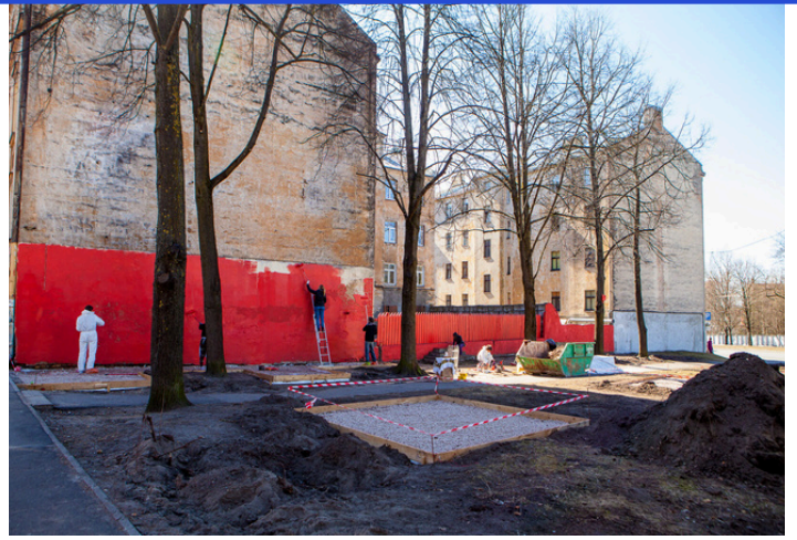
Alekša skvēra izveide “Rīga 2014” gadā

Ko jūs varētu ieteikt citām NVO, kas vēlas ieviest pārmaiņas, bet, iespējams, baidās vai nezina, kur sākt? Atrast iemeslus nedarīt, nemēģināt, pagaidīt labākus laikus vienmēr varēs. Vispirms atrodiēt – kādēļ sākt, kālab īstenot. Pēc nodefinēšanas paturiet tos prātā kā virsmērķi. Pašas veidotajos projektos nekad neesmu turējusi prātā kā pirmos argumentus “nenovērtēs”, “salauzīs”, “apķēpās”, “aiznesīs metāllūžņos”, “kurš un par kādu naudu to atjaunos”. Ir jādomā reāli un racionāli, bet reizē paceļoties virs ikdienišķā.