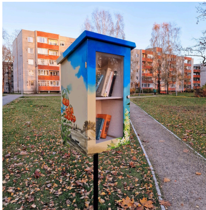
Grāmatu mājiņa Ozolaines parkā Duntē ielā (2022)

Uz pāris mēnešiem tās bija noņemtas atjaunošanai un remontam, jo diemžēl arī šīs vandaļi smagi skāra. Ar marķieriem, kurus nevar tā vienkārši notīrīt un salauztām durtiņām. Remonts nav lēts un ātrs, bet mēs cenšamies rūpēties par pašu jaunieviesto un turēt līmenī.