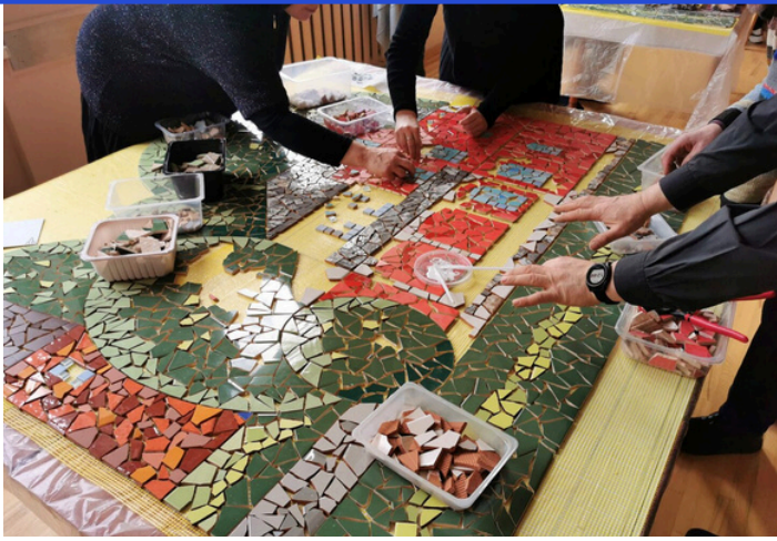
“Sarkandaugavas simbolu mozaikas” veidošanas process (2023, atrodas uz veikala “Mego” sienas Aptiekas/Tilta ielu stūrī)